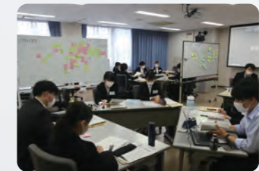
グループワークの様子