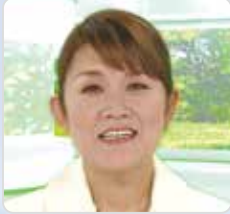
ナビゲーター 山田邦子