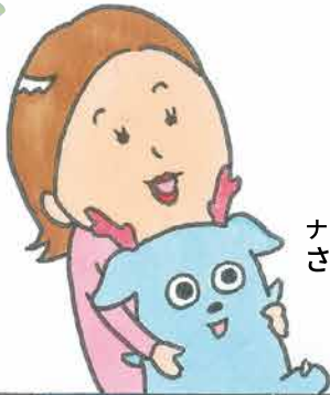
ナビゲーター さんぽん